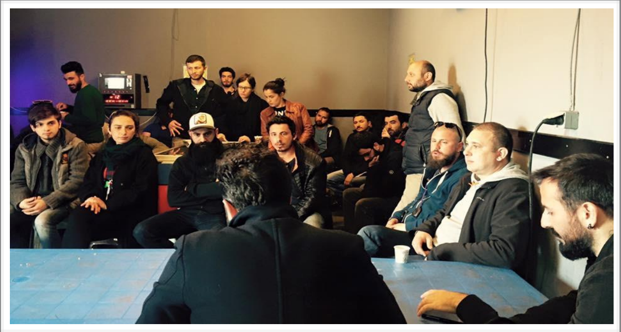
Mart ayında ' Gecenin Kraliçesi ' dizi setine ziyaretimizi gerçekleştirdik.